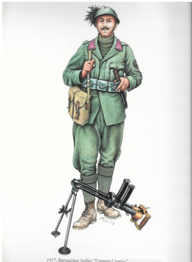
Alcune tappe relative alla nascita degli Arditi (3 di 18 tavole)